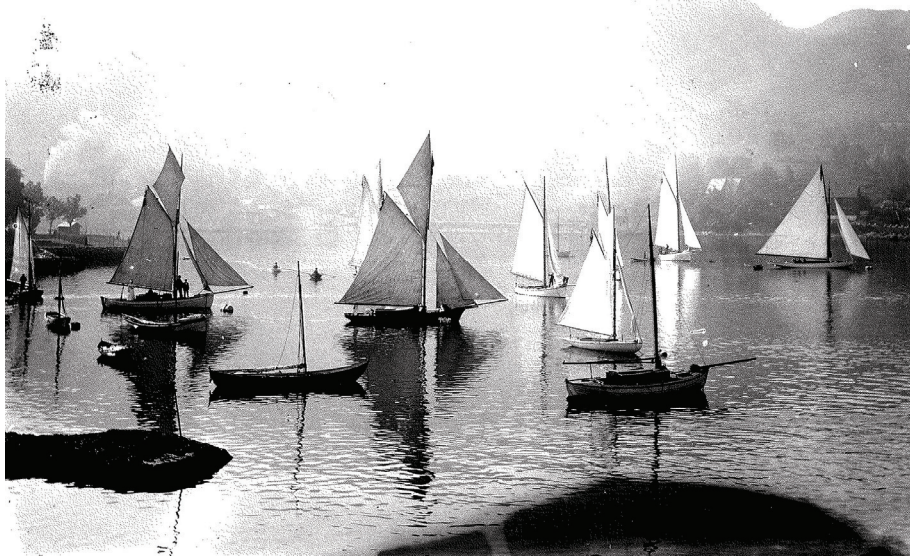
Det lå to seilforeninger som begge holdt til i Dokken ved Møhlenprisstranden. Byens første idrettsforening, Bergen seilforening, ble stiftet i 1872, og båtlaget Ran ble stiftet i 1894. Disse to båtlagene tilhørte ulike sosiale lag. Tilsvarende var det med roklubbene. Bergen roklubb ble stiftet i 1879 og roklubben Njård ble stiftet i 1880.