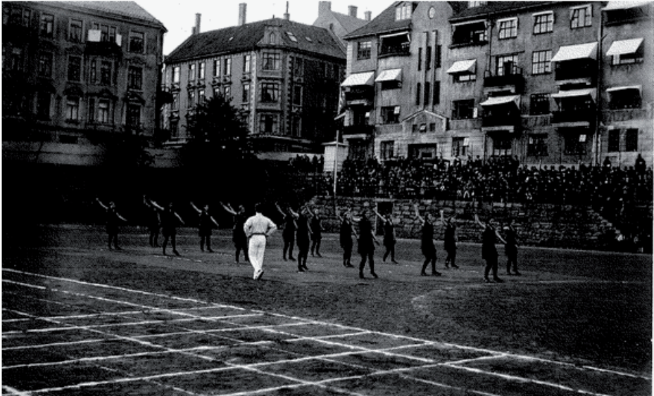
Foreningslivet på Møhlenpris avspeilet de sosiale lagene og det sterke klasses skillet mellom arbeidere og borgerskap i området. 1.mai-arrangementet var en viktig del av arbeidernes foreningsliv også innen idretten. Dette bildet er av kvinnetroppen i Arbeidernes idrettsforbund i oppvisning på Møhlenpris 1. Mai 1934.

Flere arbeideridrettsforeninger stilte da ved Trikkebyen og i Dokken ved Bredalsmarken og marsjerte med røde faner til Møhlenprisbanen. Ved 1.mai-mønstringen i 1935 deltok 6.000 idrettsutøvere i denne marsjen. Idrettsplassen har fra 1900 og frem til i dag også vært eksersisplass for buekorpset Nygaards Bataljon. Buekorpssene er fortsatt en viktig del av det tradisjonelle foreningslivet lokalt på Møhlenpris. Nygaards Bataljon har opprinnelse fra 1857, det vil si også før den første idrettsforening, Bergen seilforening, ble stiftet. I dette boligområdet fantes det to buekorps, Nygårds Bataljon og Sydnes Bataljon. I likhet med idretten var også buekorpssene delt langs klasses skillet og med tilknytning til ulike kvartal i nord og sør på Møhlenpris. Borgerskapets buekorps, Nygård Bataljon er et såkalt lørdagskorps for gutter som ikke måtte arbeide på lørdager, mens Sydnes Bataljon er et søndagskorps. Møhlenprisbanen brukes i dag også til Buekorpssenes dag som arrangeres hvert fjerde år for alle buekorps i byen.