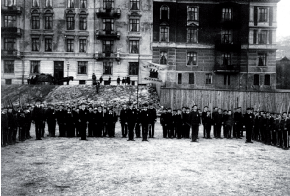
Fra 1900 og frem til i dag har Møhlenpris idrettsplass vært eksersisplass for Nygårds Bataljon. Bildet er fra bataljonens 50-årsjubileum i 1907.

Møhlenprisbanen har både før og nå vært brukt til flere andre kulturarrangement enn idrett. For eksempel i 1961 holdt Cliff Rickard konsert på banen. I følge fortellinger om arrangementet måtte imidlertid artisten gå av scenen etter kort tid på grunn av kaotiske tilstander. Uregjerlige gutter ved scenekanten truet med å rive artisten av scenen, og gjerdene ble klippet i stykker og revet ned av publikum som ikke hadde fått billett (Jensen 2007/08: 80-83). Møhlenprisbanen har altså vært brukt av et stort antall brukere og av varierte aktiviteter fra etableringen omkring århundreskiftet og frem til i dag. Ettersom bruken av banen har vært registrert, kan man se tall på omfanget av bruken både til trening, stevner og tilskuertall. Man kan for eksempel sammenligne de mest aktive 50-tallsårene med bunnårene omkring aksjonene på midten av 80-tallet: