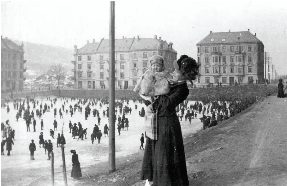
Bergen Skøiteklubb ble stiftet i 1883 og Møhlenprisbanen ble sprøytet med vann og islagt første gang i 1899. Dette bildet er tatt mellom 1906 og 1911. Kvinnen på bildet står i Professor Hansensgate i den delen av Møhlenpris hvor borgerskapet bodde. Dette er også rett før Møhlenpris skole ble bygget ved hjørnet av banen (i 1912) og før det ble reist boliger for arbeiderklassen i andre enden av denne gaten. Til venstre i bildet ses kvartalet som ble revet av kommunen i 1969. Dette medførte etableringen av Møhlenpris velforening og kravet om erstatningsboliger. Vitalitets-senteret står i dag på denne tomten.

I 1877 ble Møhlenpris, Nygård, Lungegården og Sandviken innlemmet i Bergen. Før denne utvidelsen bodde 34.388 mennesker i byen. Da sportsklubben Djerv ble stiftet i 1913, bodde det over 78.000 mennesker innenfor bygrensene. I løpet av 36 år økte altså befolkningen med over 100 %. Befolkningsveksten skapte behov for flere boliger. Hovedtyngden av boligveksten kom i områdene som ble innlemmet i byen i 1877. Det er denne utbyggingsperioden, med sine skorsteinshus i strengt regulerte gater, som dominerer boligmassen i Djervs rekrutteringsområde. Den store befolkningsveksten skapte sterkt press på tomteprisene. Spekulanter kjøpte opp store arealer og stykket dem ut til boligbygging. I løpet av en tiårsperiode ble tomteprisen tidoblet. Forhold som ble fastlagt i forbindelse med utbyggingen la rammer som har påvirket de sosiale forhold innen bydelene. Ulikheten i boligmassen la grunnlaget for sosiale skiller i området. Kulturelt kan dette avleses i fremveksten av lørdags- og søndagsbuekorps og ved lokalt grunnlag både for overklasseidretter som seiling, ridning, tennis og rosport, for vanlige idrettslag og for arbeideridrettslag (Eriksen 1994: 25).