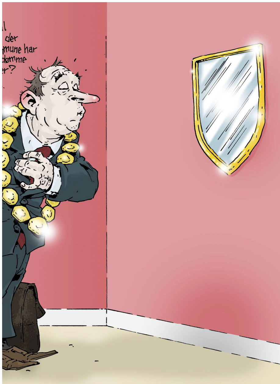
ILLUSTRASJON: SVEN TVEIT

Les flere meninger på kommunal-rapport.no/debatt